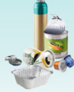
Les emballages métalliques