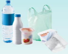
Les emballages plastiques