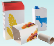
Les emballages cartonnés